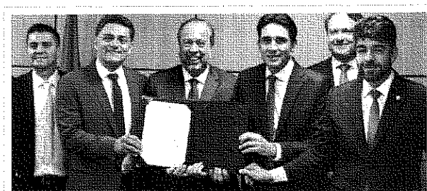
Foto 1: No dia 1º, o Governo Federal assinou o termo de compromisso para a reforma do Aeroporto.

No dia 3 de julho, o Aeroporto Municipal Santos Dumont (SNAG) recebeu uma visita técnica da Agência Nacional de Aviação Civil (ANAC), marcando a etapa final para aprovação dos projetos de recuperação da infraestrutura do terminal.